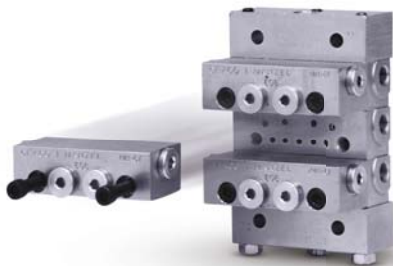
Esikootut ja testatut pohjalevyt Saatavana nyt!